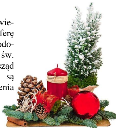
Oprac. Maćkiewicz Kamil Ib/4

Place i ulice całych Włoch, od 8 grudnia są oświetlone i udekorowane, co tworzy magiczną atmosferę świąt. Organizuje się dużo atrakcji dla dzieci: lodowiska, miejsca, gdzie można się bawić i spotkać św. Mikołaja. W okresie świąt we Włoszech zewsząd rozbrzmiewa muzyka, ponieważ organizowane są liczne koncerty oraz różnego rodzaju przedstawienia o tematyce świątecznej.